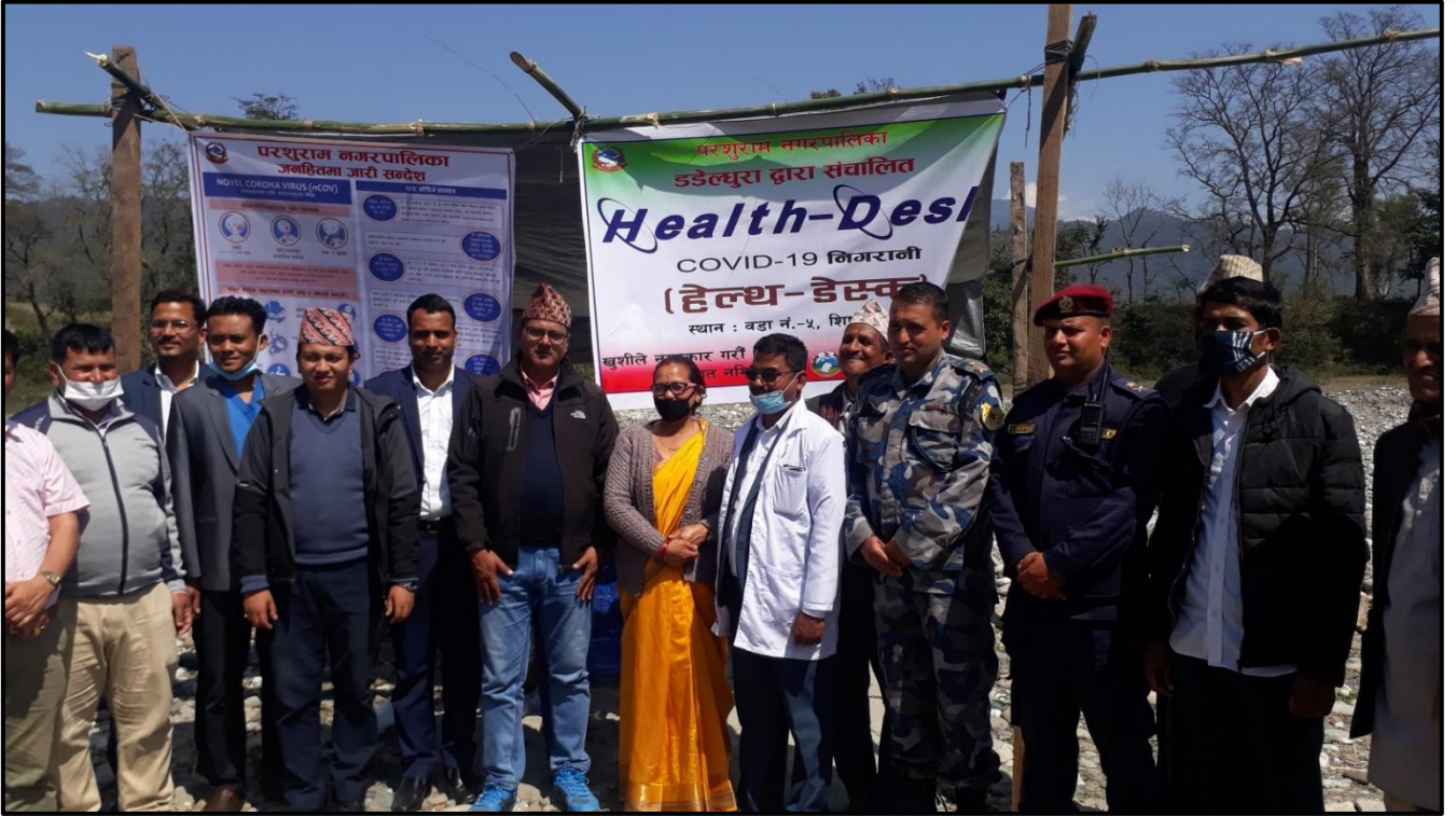
परशुराम न.पा. वडा नं. ५ शीर्ष परिगाउँमा महाकाली नदी सीमानामा मिति २०७६।११।२९ मा Health Help Desk स्थापना र सीमा क्षेत्रका व्यक्तिहरुलाई अभिमूखीकरण :