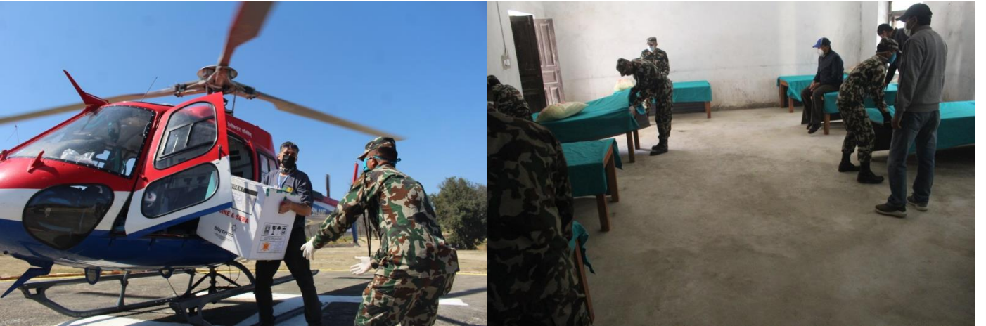
DCMC को अनुरोधमा CCMC बाट हेलिकप्टर मार्फत VTM ढुवानी