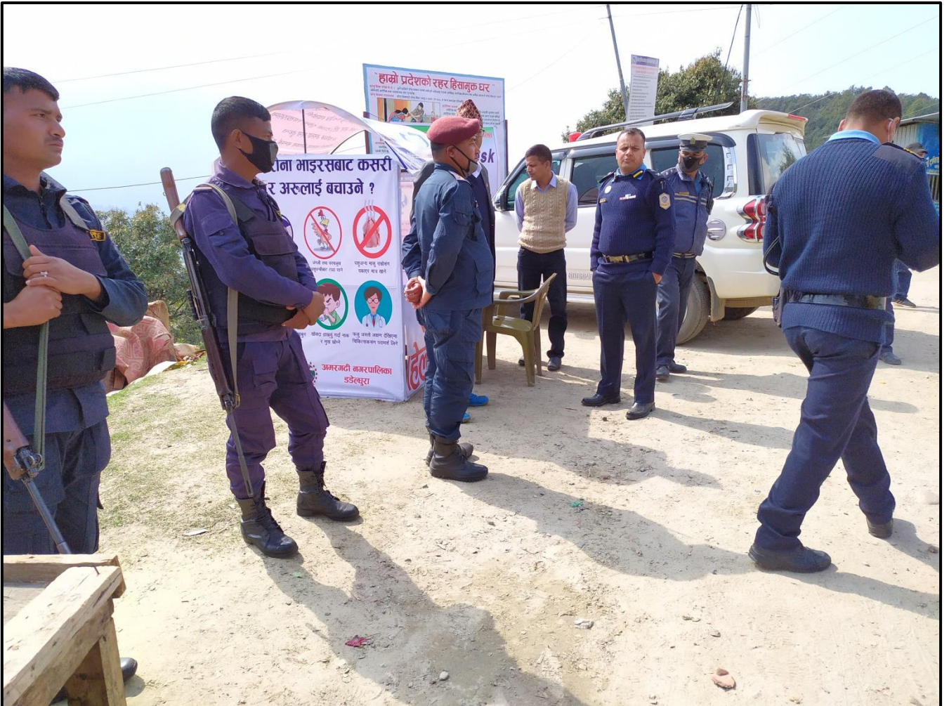
अमरगढी नगरपालिका वडा नं. १ स्याउलेमा स्थापित Health Help Desk :