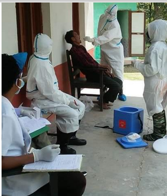
VTM बाट स्वाब नमूना संकलन